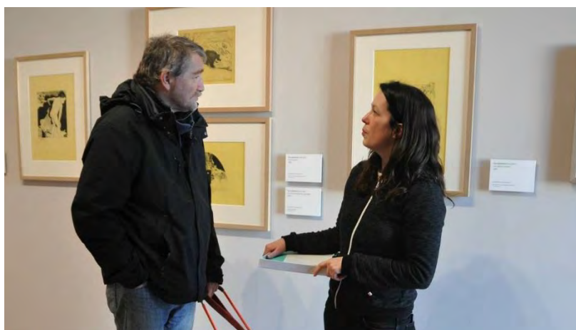
Une médiatrice culturelle mène une visite adaptée pour un groupe de malvoyants

D'autres actions de médiation hors les murs peuvent également être accompagnées par le service des publics, par le biais notamment du prêt d'une exposition itinérante et d'ateliers de pratique artistique.